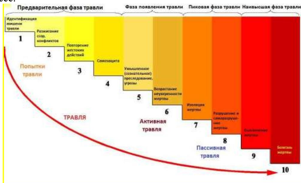
Рис. 3 Фазы буллинга

Буллинг как правило развивается по определенной схеме и имеет несколько фаз развития, которые можно изобразить как «лестницу» (рисунок 3). От момента зарождения до наивысшей фазы. Каждая ступень – это определенный этап развития, он соответствует определенному эмоциональному состоянию пострадавшего и определенным действиям обидчика. Вмешательство и прерывание процесса возможно на любой ступени, поэтому так важно распознать этот процесс.