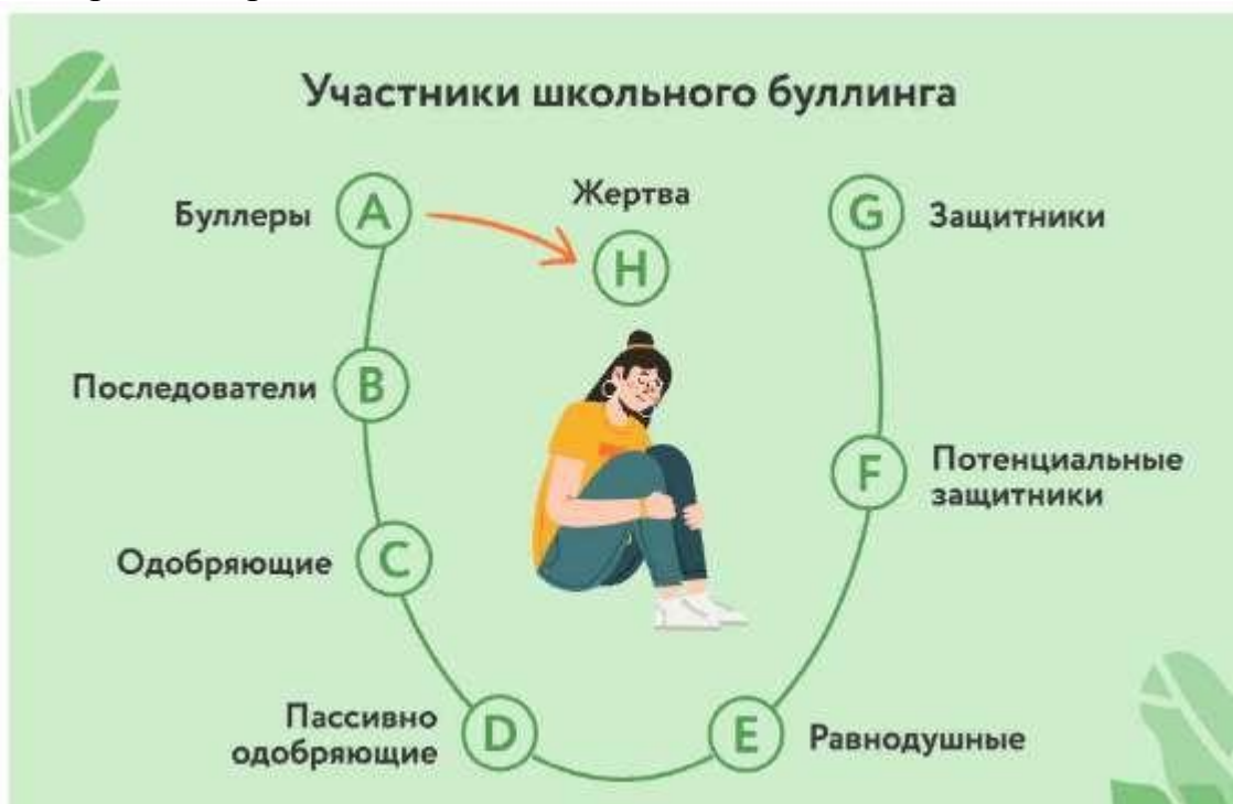
рис. 2. «Схема» буллинга

Итак, какой бы ни была причина данной ситуации, в ней всегда есть несколько «ролей» - рис. 2.